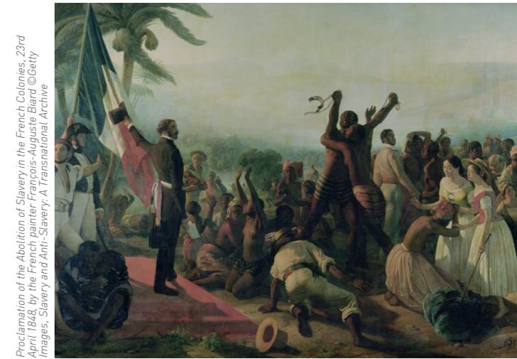
Proclamation of the Abolition of Slavery in the French Colonies, 23rd April 1848, by the French painter François-Auguste Biard