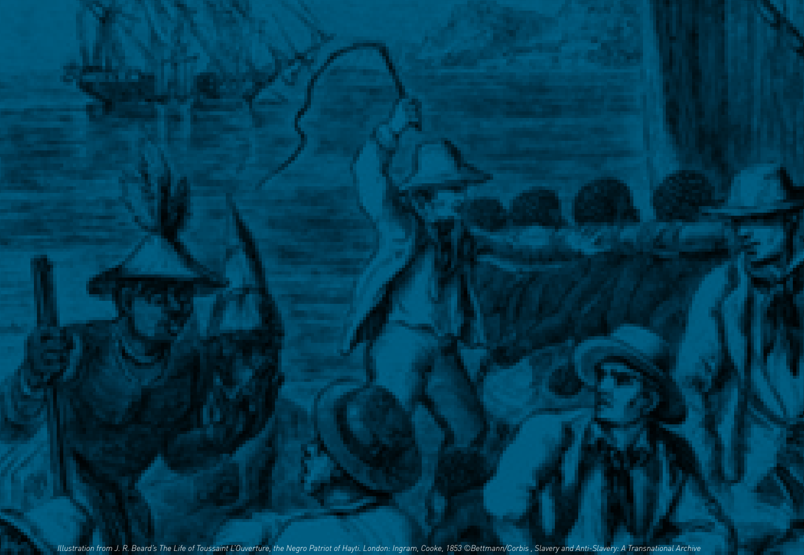
Illustration from J. R. Beard's The Life of Toussaint L'Ouverture, the Negro Patriot of Hayti . London: Ingram, Cooke, 1853 ©Bettmann/Corbis . Slavery and Anti-Slavery: A Transnational Archive