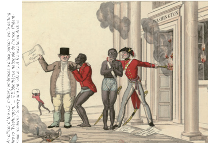
An officer of the U.S. military embraces a black person, while setting fire to Washington, ...

始于1788年邓默尔勋爵的奴隶解放提议，终于1896年普莱西与弗格森案，第四部分收录了大量与美国、拉丁美洲、加勒比地区和世界其他地区的奴隶解放运动相关的珍稀文献。从美国独立战争期间北方各州释放少量奴隶，到后期发展出越来越多的大型自由黑人团体，奴隶解放一直是人们追寻的梦想，最终成为了政治和道德诉求。